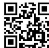
○ FU ポータル

(例) 学生の皆さん 成績発表に関するスケジュールを 公開します。 不明な点は窓口にお尋ねください。