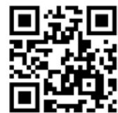
○ FU ポータル

学生の皆さん 成績発表に関するスケジュールを 公開します。 不明な点は窓口にお尋ねください。