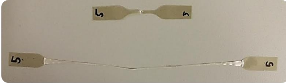
容器包装リサイクルプラスチックでの試験例 上：成形条件最適化なし、下：成形条件最適化あり