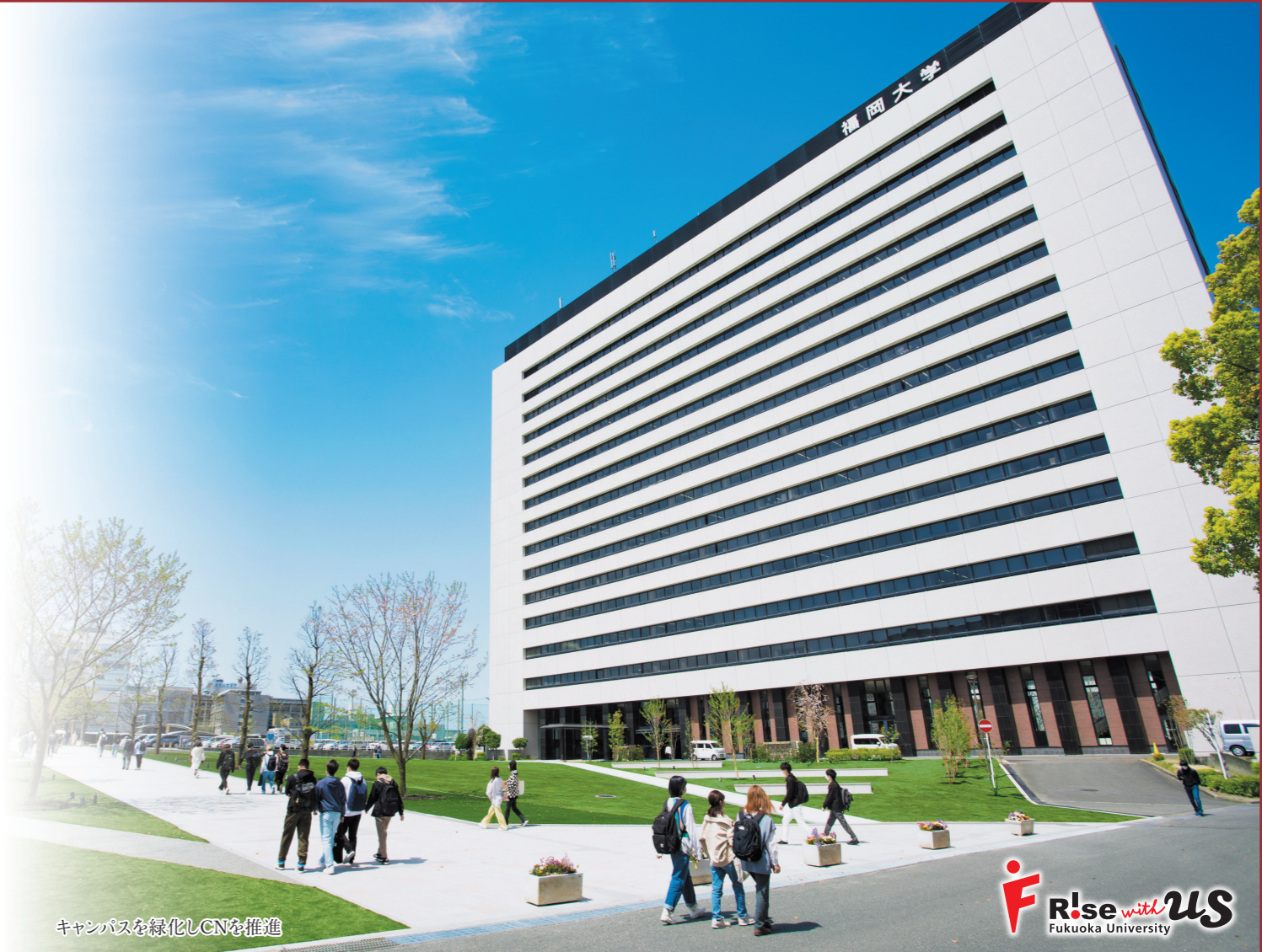
キャンパスを緑化しCNを推進