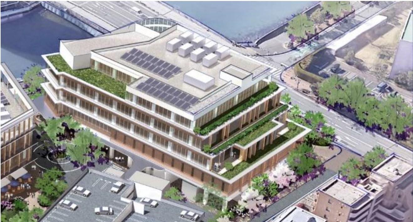
完成イメージ 南東上空より