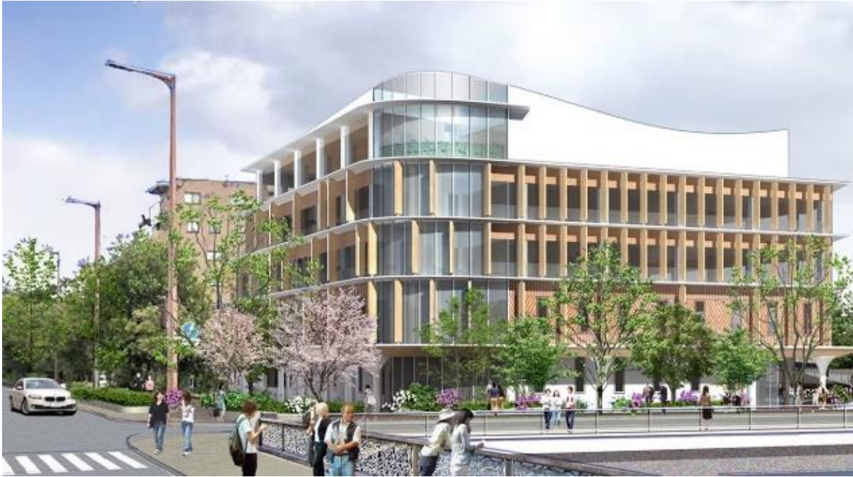
完成イメージ よかトピア通り側より

※申込開始は福岡大学西新病院、および福岡市科学館公式ホームページで案内を行います