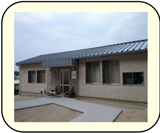
学校適応支援教室「ゆとりあ」外観