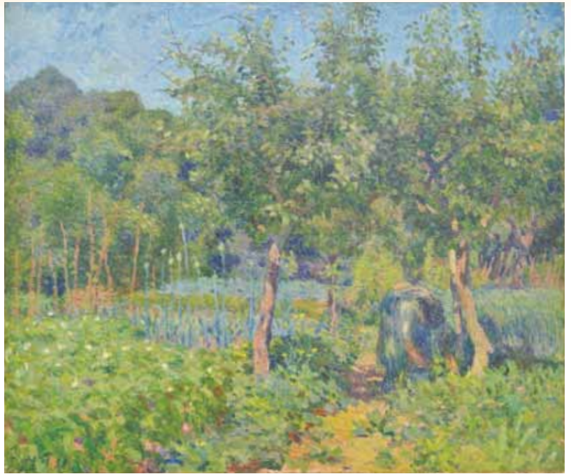
安井曾太郎《風景》1911年