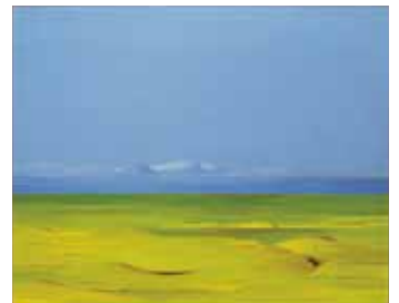
松本英一郎《河川敷の風景》1983年