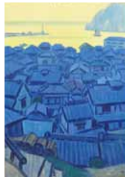
中村琢二《西伊豆の漁村》