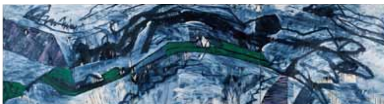
野見山暁治《卑弥呼の国》1986年

11月14日(金)、21日(金)、28日(金) 12:20~12:50 展覧会会場において、展覧会の趣旨や作品の解説を行います。