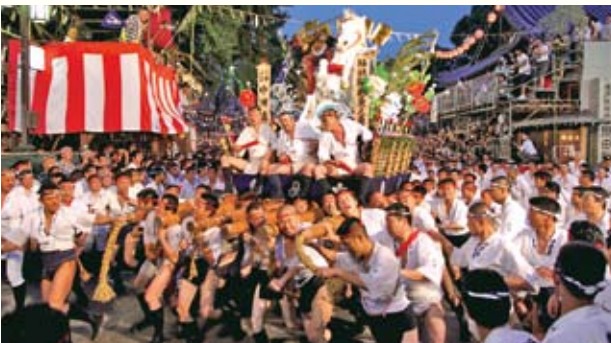
하카타 기온 아마카사 하카타 남자들의 여름축제