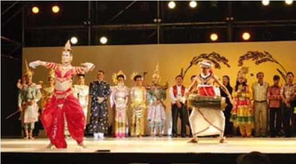
아시아 믹스 아시아 각국의 본격적인 에스닉 푸드와 예술을 만끽.