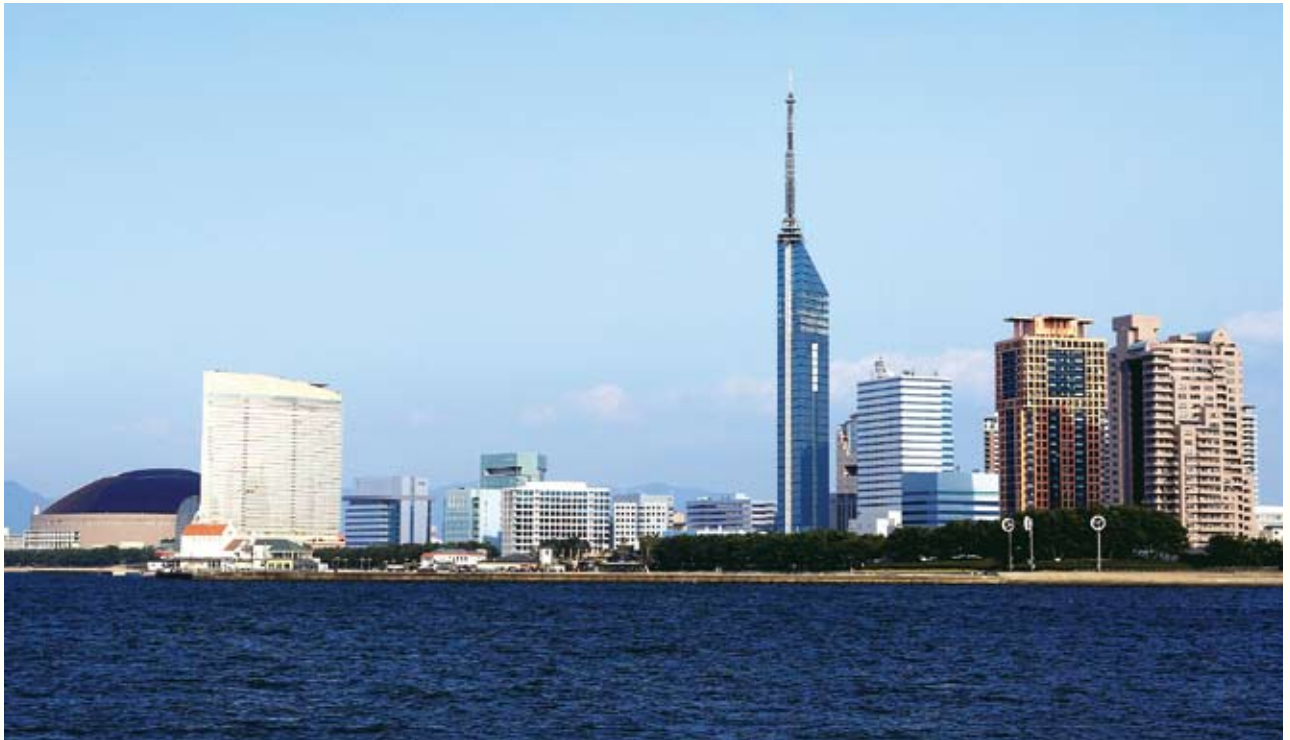
시 사이드 모모치 21세기의 신도시

후쿠오카시는 일본의 주요도시(오사카, 도쿄, 삿포로)까지의 거리와 동아시아 주요도시(부산, 서울, 상하이, 베이징, 타이베이 등)까지의 거리가 거의 동일한 범위내에 있으며 국제선의 정기항공노선도 많아 한국, 중국을 비롯하여 아시아 각국과 교류하는 데 있어 최적의 지리적 조건을 갖추고 있다.