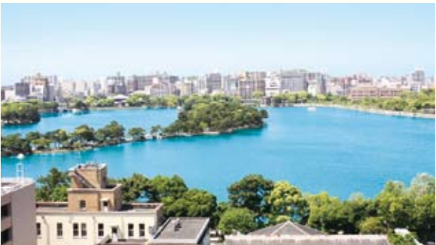
오호리 공원 나무들로 둘러싸인 연못이 아름다운 도시공원.