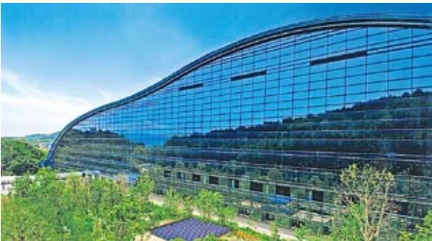
규슈국립박물관 규슈국립박물관은 아시아 역사에서 본 일본문화의 기원을 보여주고 있다.