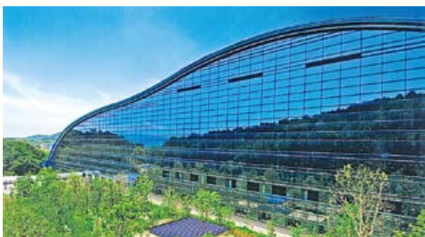
九州国立博物馆 九州国立博物馆，展示了立足于亚洲历史角度的日本文化起源。