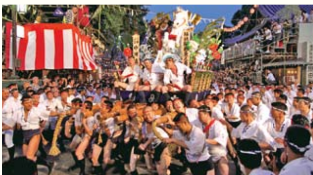
博多祇园山笠 博多男子汉的夏季祭祀活动。