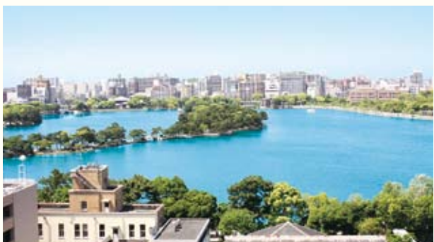
大濠公园 城市公园，树木环绕的池塘魅力无比。