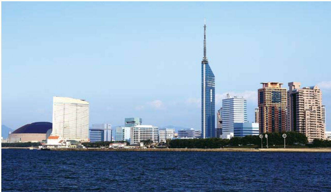
海滨百道 21世纪的新城区。

福冈市距日本各主要都市（大阪、东京、札幌）的距离与距东亚各主要都市（釜山、首尔、上海、北京、台北等）的距离大致在同一量级，加之拥有众多的国际航线定期航班，可以说福冈市正处于与韩国、中国等亚洲国家进行交往的最佳位置。