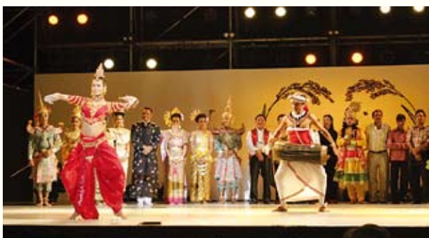
亚洲月 可以领略到亚洲各国的风土人情。